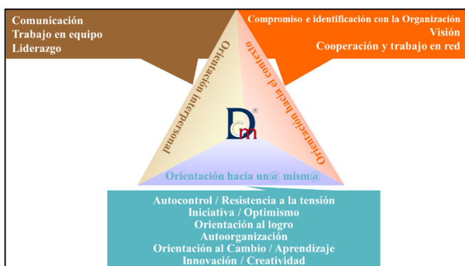
Figura 1. Competencias D.C.M. ®

D.C.M. ® es un modelo de análisis de competencias, que tiene su origen en el ámbito profesional y que ha desarrollado un perfil específico para estudiantes de estudios superiores. Analiza doce competencias, que se agrupan en tres ámbitos (orientación hacia uno mismo, interpersonal y hacia el contexto), como se muestra en la Figura 1, y que resultan de especial relevancia en procesos de valoración del desempeño profesional.