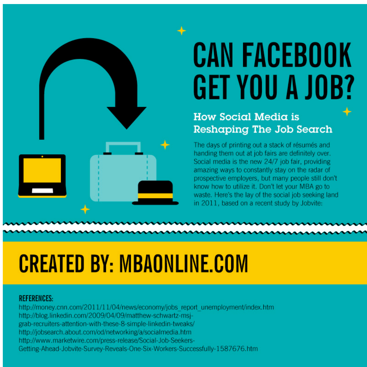
Figura 1. Infografía completa en http://images.mbaonline.com.s3.amazonaws.com/social-job-search.jpg . Creada por MBA Online ( http://www.mbaonline.com )

En cuanto a los portales de búsqueda de empleo en internet, la falta de transparencia hace que resulten controvertidos, e incluso a veces, engañosos. En ellos se introduce una gran cantidad de datos personales y profesionales y la información que se obtiene a cambio de ello, no queda nunca muy clara. No solemos saber la veracidad de las ofertas de trabajo, ni tenemos suficiente información sobre