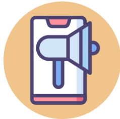
Creación y validación de marca