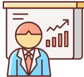
Modelo de negocios