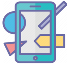
Experiencia de usuario